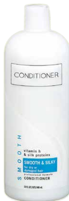
kremowa odżywka do włosów do splotkiwania, odżywka do wmasowania lub balsam